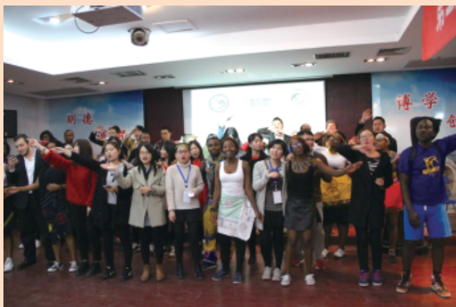
◆参加南非德班理工大学孔子学院冬令营活动