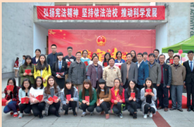
◆法学专业师生参加“12.4”法制宣传活动

学院继续秉承“文以载道，法以治国”为核心的文法精神，坚持“内涵发展，提升质量，发挥优势，办出特色”的办学思路，不断加强学科建设和师资队伍建设。全体教职工将开拓进取、努力拼搏，为培养具有国际视野的高素质人才而奋斗。