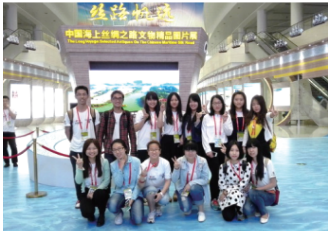
◆英语专业学生担任英语向导、翻译志愿者

培养效果： 学生语言基本功扎实，英语专四、专八成绩远高于全国平均水平。毕业生主要在商务、经贸、外事、文教、科技、旅游等国内外企事业单位就业，从事翻译、商务、教学、管理、科研等工作。部分毕业生顺利考取英国、澳大利亚以及香港、厦门大学等国内外著名大学英语语言文学、经贸、翻译等方面硕士研究生。