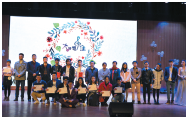
◆ 学院“大梦想·佳”第十三届十佳歌手大赛

计、管理等方面工作，成为高等院校、事业单位和生物质材料、家具、室内装潢等企业单位的学术带头人、技术骨干和管理人才。