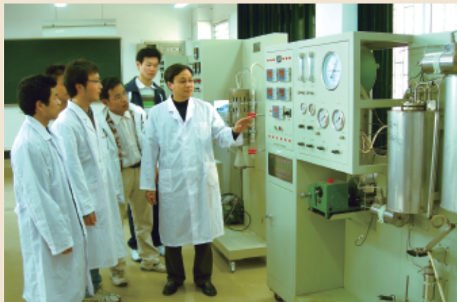
◆国家科技进步二等奖获得者、国家有突出贡献的中青年专家、国家“百千万人才工程”人选、国务院政府特殊津贴专家陈礼辉教授指导学生实验