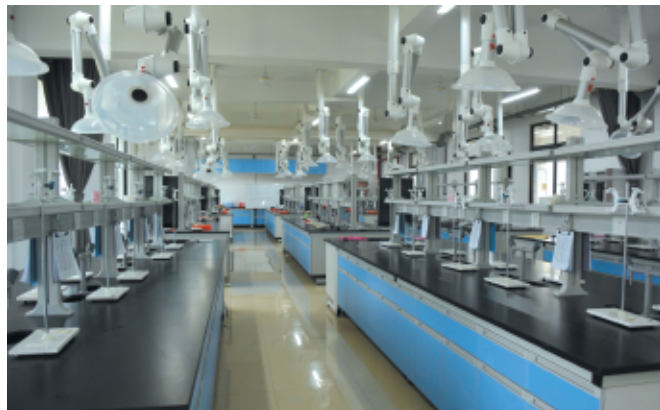
◆ 材料工程学院专业化学实验室