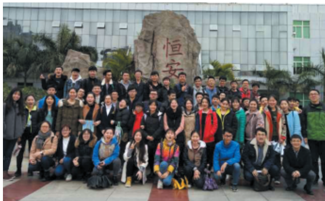
◆ 轻化工程专业学生在恒安集团实习

培养效果： 近几年，毕业生就业率达95%以上，毕业生主要从事轻工、化工、高分子材料等领域的教学、研究、设计和管理方面的工作，成为高等院校、事业单位和轻工、精细化工、高分子材料等企业单位的学术带头人、技术骨干和管理人才。