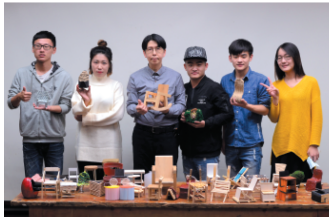
◆ 木材科学与工程专业交换生在台湾嘉义大学学习

就业情况： 近几年，毕业生就业率达98%以上，主要从事生物质材料、家具、室内装潢等领域的教学、研究、设