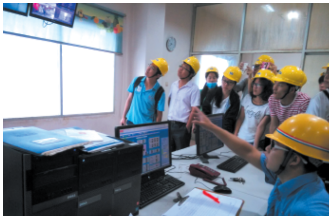
◆ 新能源科学与工程专业学生在青山纸业股份有限公司实习

培养效果： 毕业生就业率达95%以上，攻读硕士学位人数达到15%以上，主要从事生物质能源、太阳能、核能工