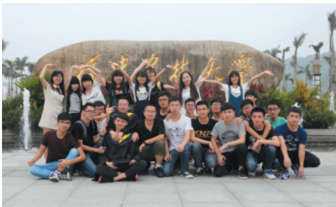
◆ 化学工程与工艺专业优秀毕业生与在校生代表合影