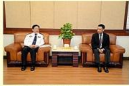
• 张文彪院长会见泰国威拉蓬中将