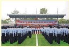
• 金砖国家厦门会商安保团队出征仪式