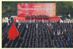
• 出征亚运会誓师大会