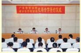
• 校局合作签约仪式