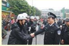
• 院领导看望参加春运执勤学生