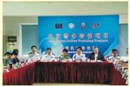
• 中澳警务合作培训项目