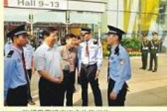
• 院领导看望广交会执勤学生