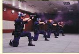
• 全天候仿真射击场