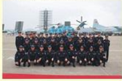
• 珠海航展执勤团队